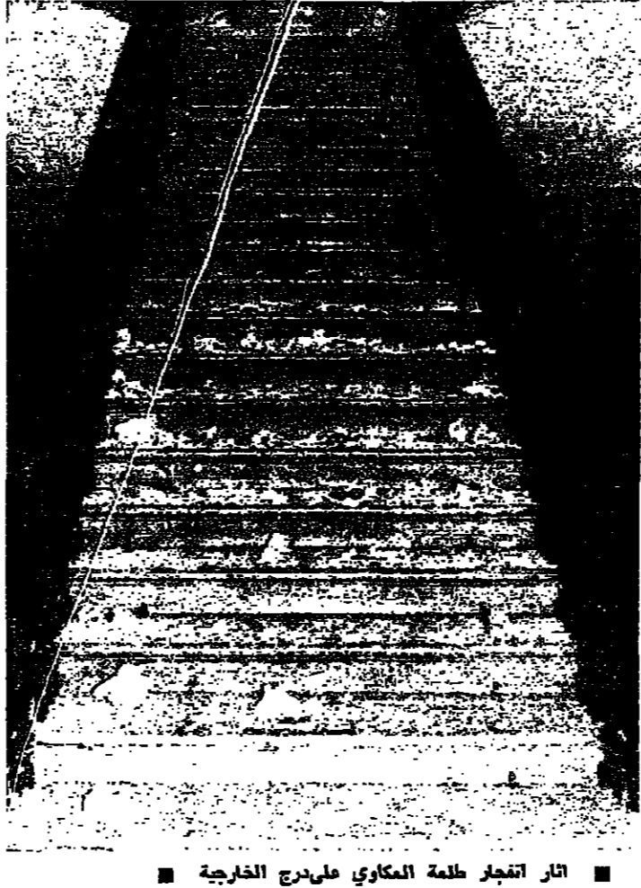
الانفجار طغى على مخرج الخرجية

قال السيد دودي شعومون أمين عام حزب الوطني الحر: «بعدما حدثت هذه المأساة التي لا يمكن أن يكون لها مسبب سوى المؤامرة التي شتمت على لبنان، ونحن ندين على قوتها التي لا يمكن أن يكون لها مسبب سوى المؤامرة التي شتمت على لبنان، ونحن ندين على قوتها التي لا يمكن أن يكون لها مسبب سوى المؤامرة التي شتمت على لبنان...»